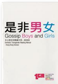
過去數年，她幾近獨力支撐跨性別資源中心的運作，包括寫了這本介紹香港跨性別社群狀況的小書。

接受變性手術後，我本來想做點生意，但這幾年都專注跨性別運動，除了在港大做研究助理，基本上沒有收入，積蓄都差不多耗盡。最近跨性別資源中心獲得撥款，我開始全職做中心工作。收入比不上從前，但可以做一份自己真心想做的工作，我很感恩。除了訪問和講座，現在我每星期會花四至八小時見個案，又計劃做一些關於跨性別調查，始終香港太缺乏這方面的數據。另外，我希望多找幾個人，籌辦一個專講跨性別議題的網台。很忙，很累，但我不敢不做，十多年前，有兩個跨性別朋友先後自殺，他們對我都很好。我不想再有身邊的朋友自尋短見。U